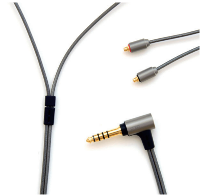
ict_04_b14m_120 4.4 5極プラグ - mmc(l/r) 6N + 銀鍍金 4N銅 pvc ジャケット 4.4-5p:金メッキ仕上げ (L型) mmcコンタクト:金メッキ仕上げ チタン 素地 プラグキャップ 長さ:1.2m jan:4534165013569