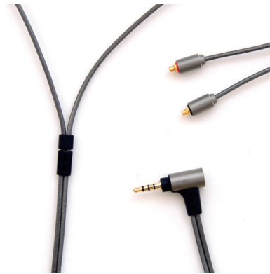
ict_04_b12m_120 2.5 4極プラグ - mmc (l/r) 6N + 銀鍍金 4N銅 pvc ジャケット 2.5-4p:金メッキ仕上げ (L型) mmcコンタクト:金メッキ仕上げ チタン 素地 プラグキャップ 長さ:1.2m jan:4534165013545