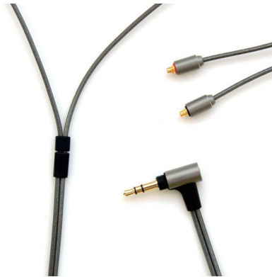
ict_04_ub3m_120 3.5 ステレオプラグ - mmc (l/r) 6N + 銀鍍金 4N銅 pvc ジャケット 3.5-3p:金メッキ仕上げ (L型) mmcコンタクト:金メッキ仕上げ チタン 素地 プラグキャップ 長さ:1.2m jan:4534165013538